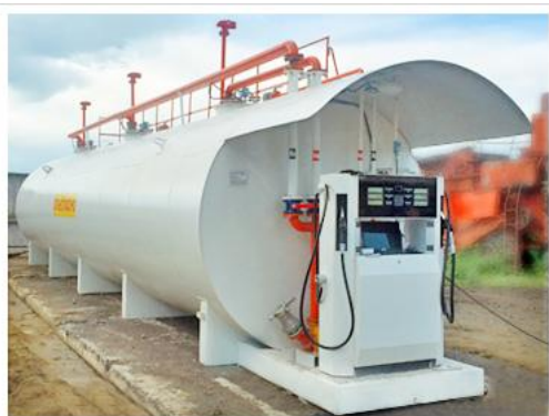
МОДУЛЬНЫЕ АЭС 5-120 КУБ.М.