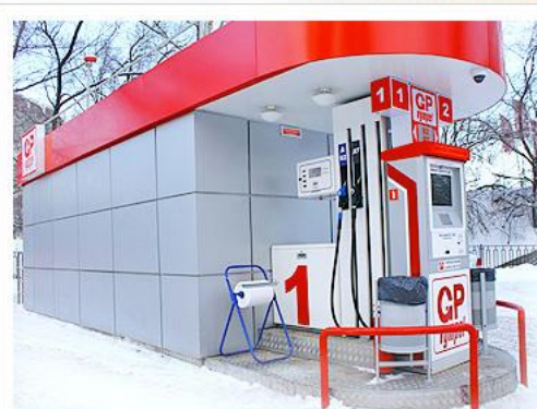
КОММЕРЧЕСКИЕ КОНТЕЙНЕРНЫЕ АЭС 5-60 КУБ.М.