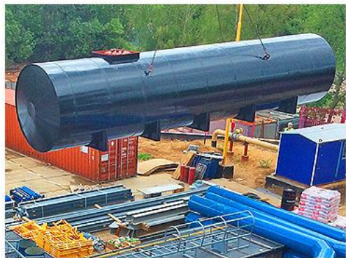
РЕЗЕРВУАРЫ ГОРИЗОНТАЛЬНЫЕ СТАЛЬНЫЕ - РГС