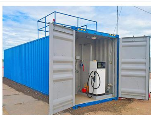
КОНТЕЙНЕРНЫЕ АЭС 5-60 КУБ.М.