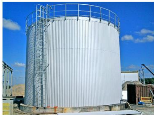
РЕЗЕРВУАРЫ ВЕРТИКАЛЬНЫЕ СТАЛЬНЫЕ - РВС