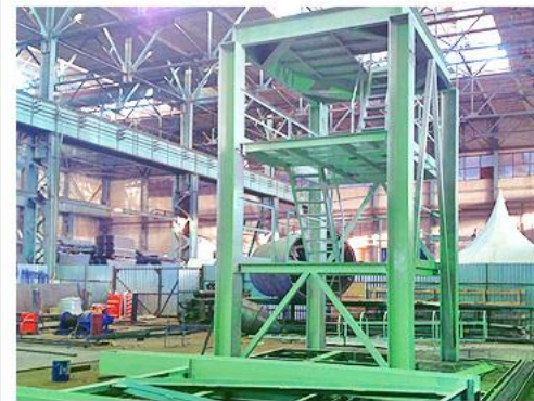
МЕТАЛЛОКОНСТРУКЦИИ ПОД ЗАКАЗ