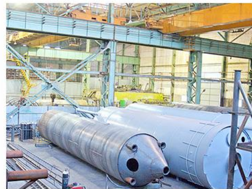
СИЛОСА СТАЛЬНЫЕ ДЛЯ СЫПУЧИХ МАТЕРИАЛОВ