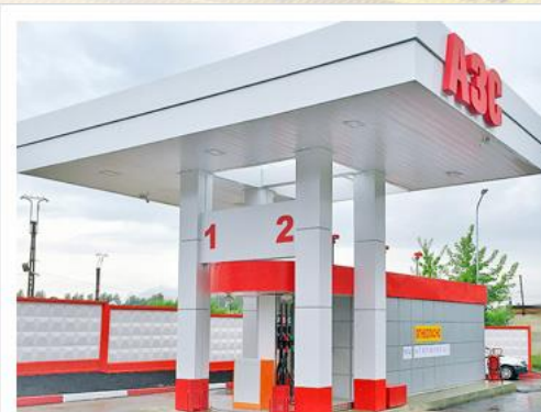
БЛОЧНЫЕ АВТОМАТИЧЕСКИЕ АЭС

ПОЛУЧИТЕ РАСЧЕТ ЗА ЧАС ЗВОНИТЕ НАМ ПО НОМЕРУ ТЕЛ: +7 (495) 135-25-90